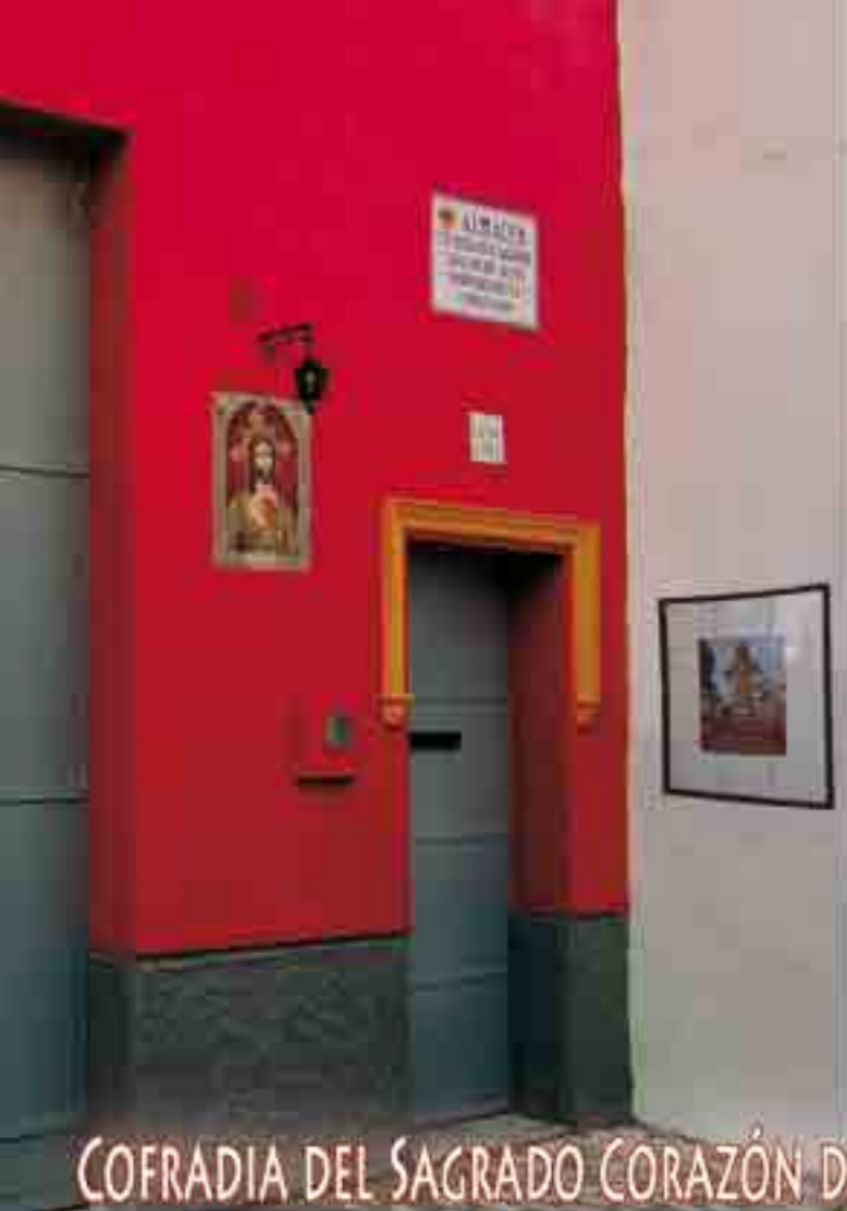
COFRADIA DEL SAGRADO CORAZÓN DE JESÚS DE SEVILLA