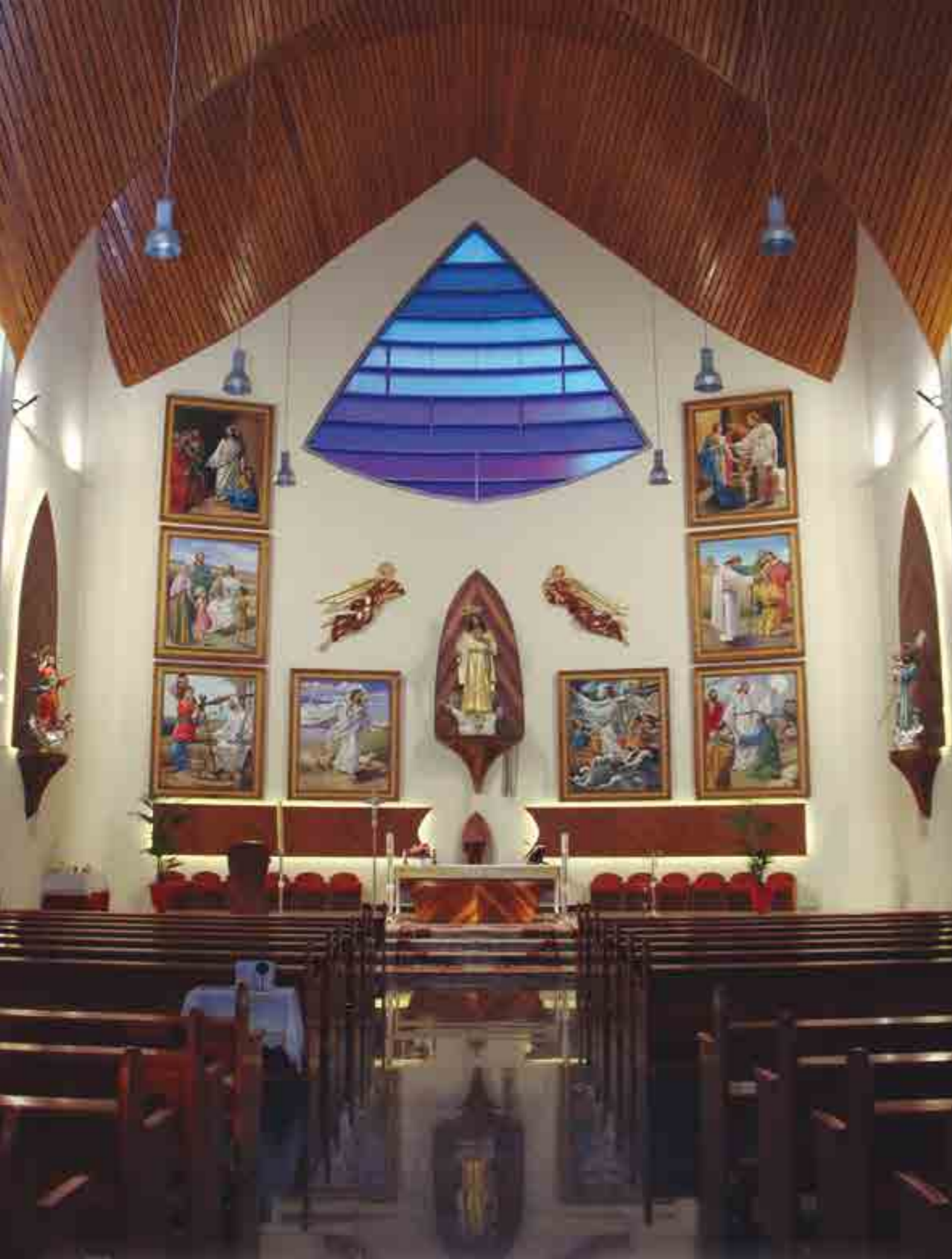
RETABLO DE LA PARROQUIA DEL SAGRADO CORAZÓN DE JESUS DE TOREVIEJA