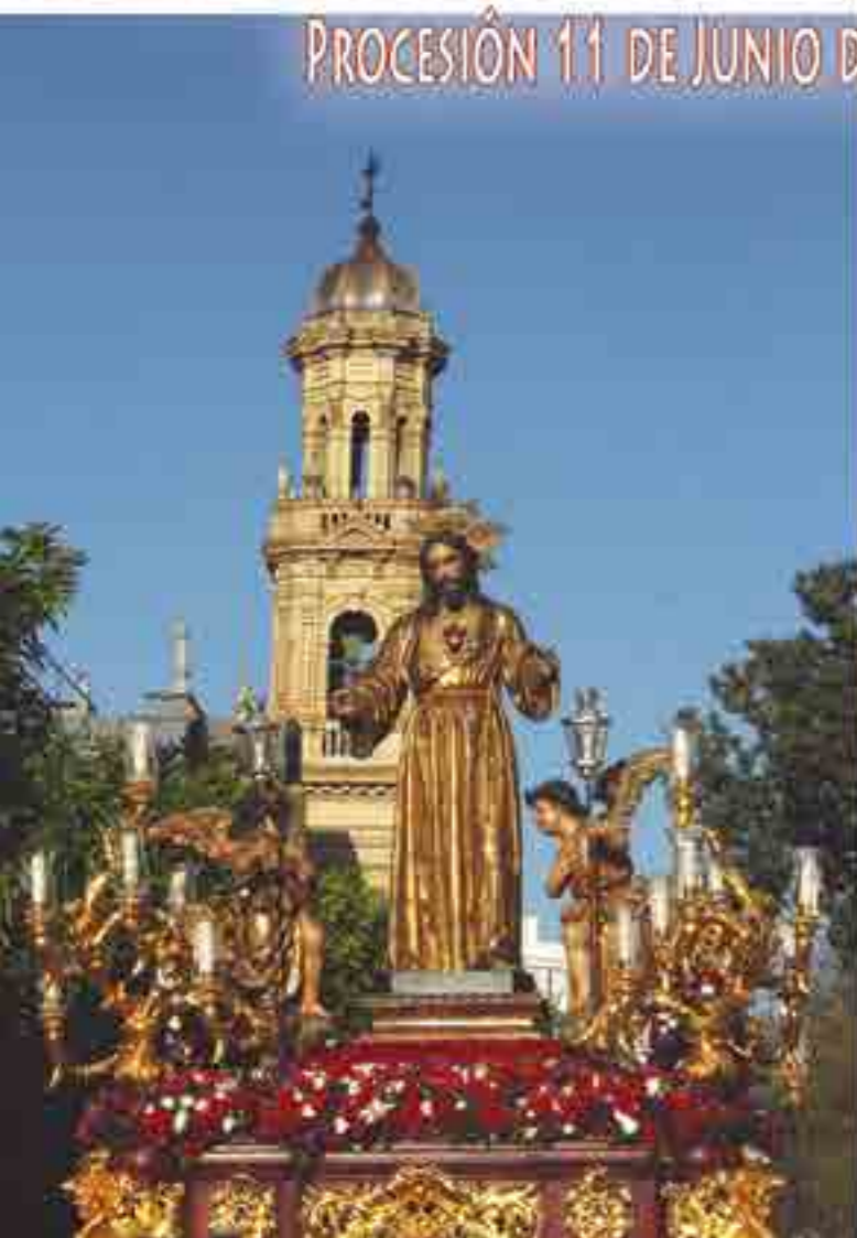
PROCESIÓN 11 DE JUNIO DE 2017